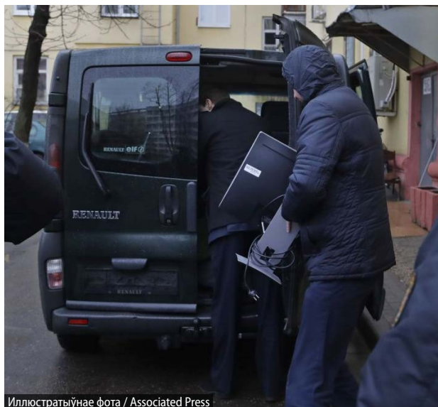
Ілюстратыўнае фота / Associated Press

Каментуючы яе, Канстанцін Бычак, намеснік кіраўніка следчага ўпраўлення КДБ Беларусі, сказаў: