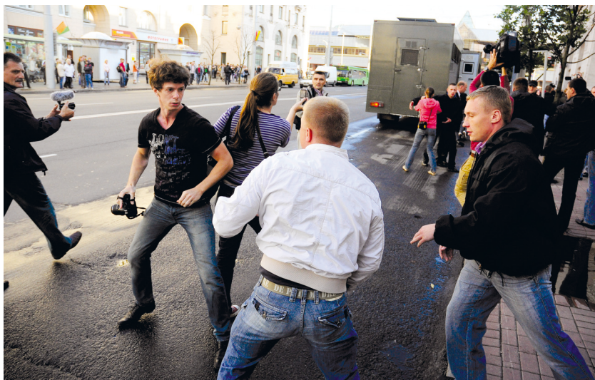
«Не снимать!»