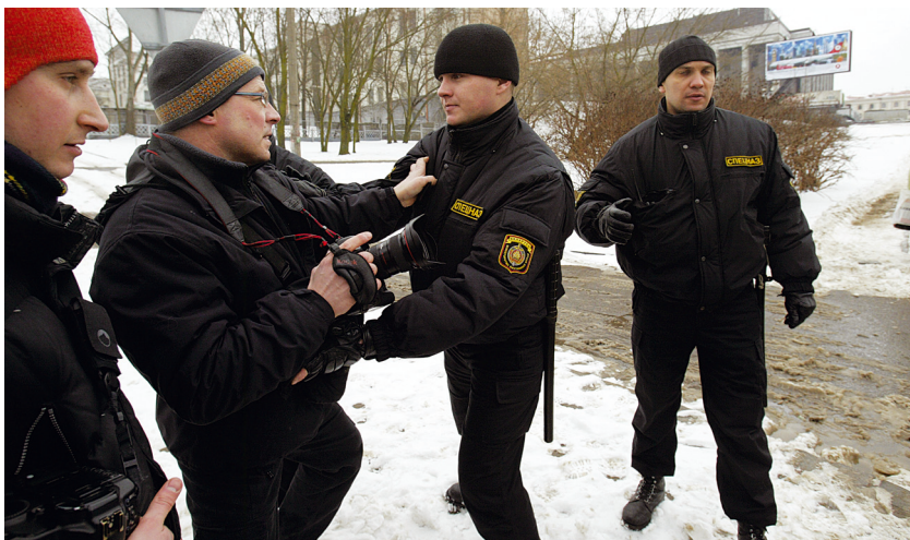
Спецназ против фотокорреспондентов.

Право журналиста делать записи в отношении физических или юридических лиц, в том числе с использованием средств аудиовизуальной техники, кино- и фотосъемок, связывается с наличием аккредитации или согласования с этими лицами, «если иное не предусмотрено законодательством Республики Беларусь». Одно из исключений из этого правила — проведение аудио- и видеозаписи, кино- и фотосъемок в местах, открытых для массового посещения и на массовых мероприятиях.