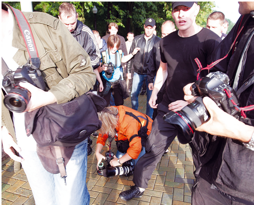
Люди в черном выбивают камеры из рук журналистов.