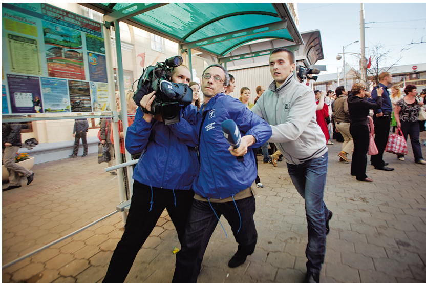
Корреспонденты российского телеканала ОРТ аккредитованы и обозначены, но снимать им мешают.

портж, ни один кадр или видеоряд, какими бы они ни были с профессиональной точки зрения, не стоят вашего здоровья (тем более — жизни!).