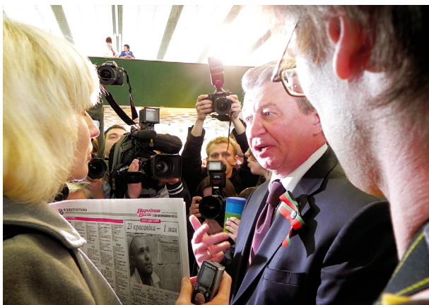
На выставке «СМИ в Беларуси-2011» журналисты выступают в защиту негосударственных газет. На переднем плане справа — первый заместитель главы администрации президента А. Радьков.

(предшественник Министерства информации) была закрыта газета «Свабода», в ноябре 2001 г. по иску прокуратуры Гродненской обл. — газета «Пагоня», а в 2006 г. по иску Министерства информации — газета «Згода». Весной 2011 года, как мы уже писали, Министерство информации обратилось в Высший хозяйственный суд с исками о закрытии двух ведущих негосударственных общественно-политических газет «Наша Ніва» и «Народная воля» (показательно, что именно эти газеты были возвращены властями в государственные сети распространения в розницу и по подписке в конце 2008 г. в знак готовности к диалогу с Европой — и они же попали под удар, когда отношения с европейскими структурами резко ухудшились). Благодаря громкому резонансу этого дела Министерство информации (или те, кто стоял за всей этой историей) отозвало иски. Власти предпочли иной способ привлечь издания к ответственности: редакции были оштрафованы за «нарушение средством массовой информации законодательства о средствах массовой информации по»