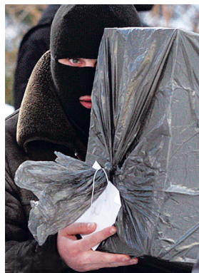
Массовые обыски и изъятие техники в редакциях, декабрь 2010 года.

Вторая волна массовых обысков настигла СМИ после последних президентских выборов в Беларуси (19 декабря 2010 года) — из помещений редакций и квартир журналистов сотрудниками КГБ было изъято 114 единиц профессионального оборудования.