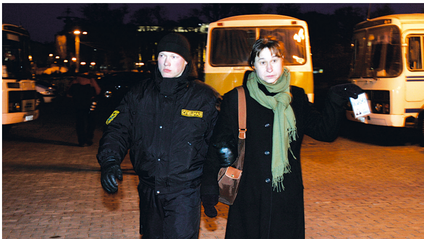
Журналистку задерживают, несмотря на удостоверение.

4.9. при осуществлении профессиональной деятельности предъявлять по требованию служебное удостоверение. Форма служебного удостоверения журналиста средства массовой информации, зарегистрированного на территории Республики Беларусь, устанавливается республиканским органом государственного управления в сфере массовой информации.