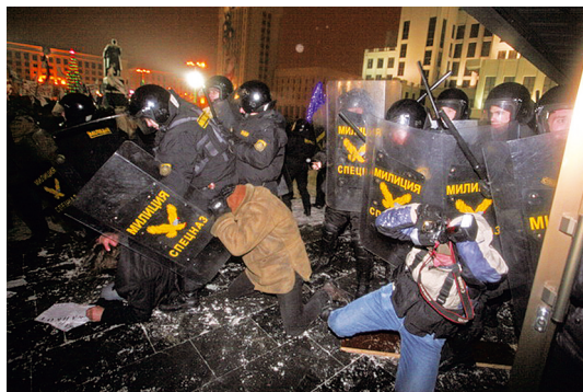
Журналисты в гуще событий 19 декабря 2010 года.

«Когда я снимал одну из молчаливых акций в прошлом году, заместитель начальника городской милиции от-